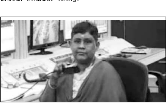
●ചന്ദ്രയാൻ-3 വിക്ഷേപണസമയത്ത് കാൺഡൗൺ അനൗൺസ് മെറ്റ് നടത്തുന്ന വളർമതി.

കുളത്തക്കുഴിയിൽനിന്നു കയറുകാരി വരുമ്പോൾ അമ്പലത്തിനാൽ പടിവളവിൽ പത്തടി താഴ്ചയിലുള്ള ബോളി ലേക്കാണ് ആംബുലൻസ് തലകീഴായി മറിഞ്ഞത്. ബഹളം